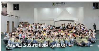
유아교육과(2023 어린이날 주년 행사)