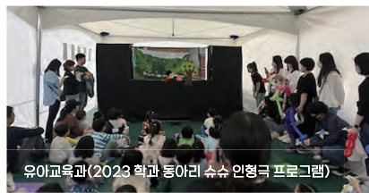
유아교육과(2023 학과 동아리 슈슈 인형극 프로그램)