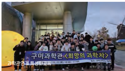
과학관연계 특성화교육 (기.11.18) 10:00~11:00