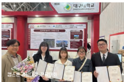
캠스톤 컨퍼런스 전시대회